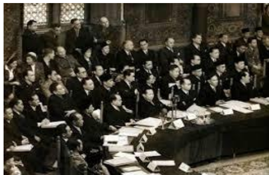
Gambar 2. Merumuskan Persiapan Kemerdekaan

nasional merupakan manifestasi kesadaran