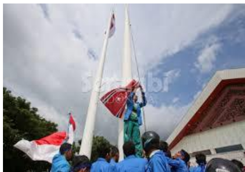
Gambar 8. Semangat berdiskusi nasionalisme

Masa pemerintahan Susilo Bambang Yudhoyono memenangi pemilu 2004, menyebabkan second track diplomasi dapat dijalani dengan baik. Musibah tsunami 26 Desember 2004 membawa berkah turut mengambil peran jalannya perdamaian di Aceh. Pemerintah dan GAM memilih solusi damai pada Januari hingga Juli 2005, pemerintahan SBY-JK melakukan lima kali “pertemuan informal”