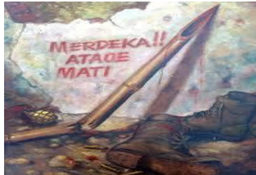
Gambar 4. Motivasi nasionalisme berjuang

Kentalnya kaitan nasionalisme dengan perjuangan melawan penjajah pada masa tersebut turut menyebabkan keterbatasan pemahaman definisi nasionalisme. Ungkapan