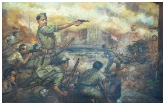
Gambar 5. Perjuangan merebut kemerdekaan

Menumbuhkan nasionalisme sampai pada taraf wujud perilaku harus ditumbuhkan kesadaran sejarah sebagai orientasi intelektual, suatu sikap jiwa yang perlu memahami secara tepat faham kepribadian nasional. Kesadaran sejarah ini menuntun manusia pada pengertian mengenal diri sendiri sebagai bangsa, kepada self-understanding of nation , kepada sangkan paran suatu bangsa, kepada persoalan what we are, what we are what we are (Soedjatmoko, 1984) 5 Dengan demikian, kesadaran sejarah merupakan kondisi kejiwaan yang menunjukkan tingkat penghayatan pada makna dan hakekat sejarah bagi masa kini dan bagi masa yang akan datang, menyadari