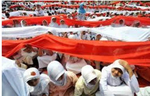
Gambar 6. Perjuangan merebut kemerdekaan

setiap warga negara mempunyai kedudukan, hak dan kewajiban yang sama, karena hakikanya kebangsaan adanya tekad hidup bersama