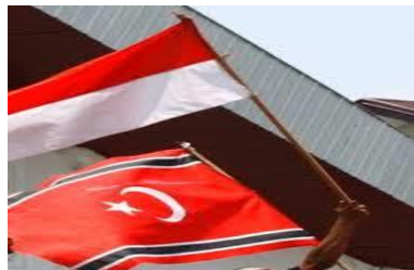
Gambar 7. Pengibaran dua bendera

Benang kusut nasionalisme di Aceh berdalih faktor ketimpangan ekonomi dan ketidakadilan antara pusat dan daerah. Pada era Soeharto, Aceh menerima 1% anggaran pendapatan nasional dari kontribusi 14%. Meningkatnya tingkat produksi minyak bumi dihasilkan Aceh pada