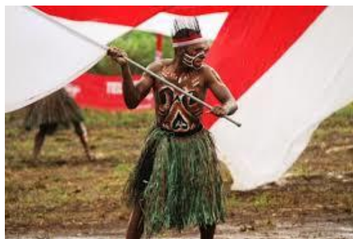
Gambar 9. Nasionalisme ganda orang Papua

Penduduk Indonesia menduduki ribuan kepulauan di Nusantara dari Sabang sampai Merauke, terdiri atas bermacam-macam suku bangsa, menganut berbagai agama, paham politik aneka aliran, namun karena mempunyai persamaan asal-