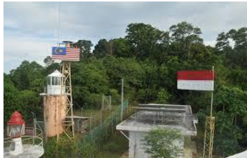
Gambar 10. Perbatasan Indonesia Malaysia

Perbatasan merupakan wilayah yang rawan untuk terjadinya konflik, baik konflik kepentingan politik, ekonomi ataupun budaya, karena itu kesungguhan pemerintah dalam menjaga