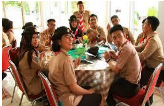
Gambar1. Semangat berdiskusi nasionalisme

Nasionalisme dalam perpektif konsep dan paham diasumsikan bahwa nasionalisme merupakan suatu konsep yang berpendapat bahwa kesetiaan individu diserahkan sepenuhnya kepada Negara (Syamsudin, 1988).